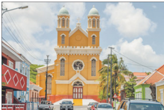
„Twee keer speelt de Santa Famia-kerk in Otrobanda een belangrijke rol in het leven van de hoofdpersoon. Religie is een steeds terugkerend motief.“