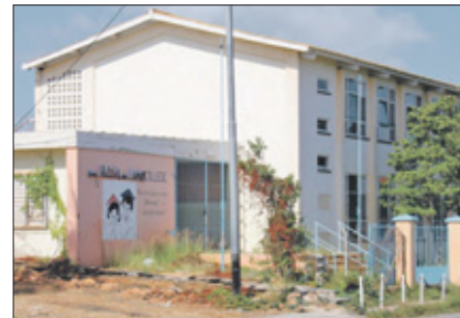
Ook het tekortschietend onderwijs is een belangrijk onderwerp in het boek van Hart.

De verteller maakt in het gecompliceerde verhaal uitbundig gebruik van beeldspraak en stijlverschijnselen als parallelisme, contrast en spiegeling. Standpunten die door het ene personage worden verkondigd, worden vervolgens door het tegengestelde personage ontzenuwd. Bepaalde gebeurtenissen en personages krijgen extra relief door herhaling in het vervolg van het verhaal. Zo wordt de jonge vrouw Chola in het eerste romandeeel gespiegeld met Yolande in het derde deel, die als vriendinnen van Frensel op hun beurt weer gespiegeld worden met Xiomara, de vriendin van Giovanni. De volstrekt tegengestelde levenshoudingen van Frensel en Giovanni worden aanvankelijk in gescheiden hoofdstukken verteld tot de levenslijnen elkaar in het tweede en derde deel raken. De tegenstelling tussen de pastoor en de politicus op Curaçao zetten zich