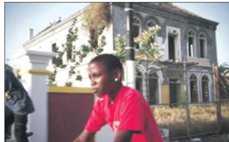
In het boek komt het probleem van de verloeding duidelijk naar voren.